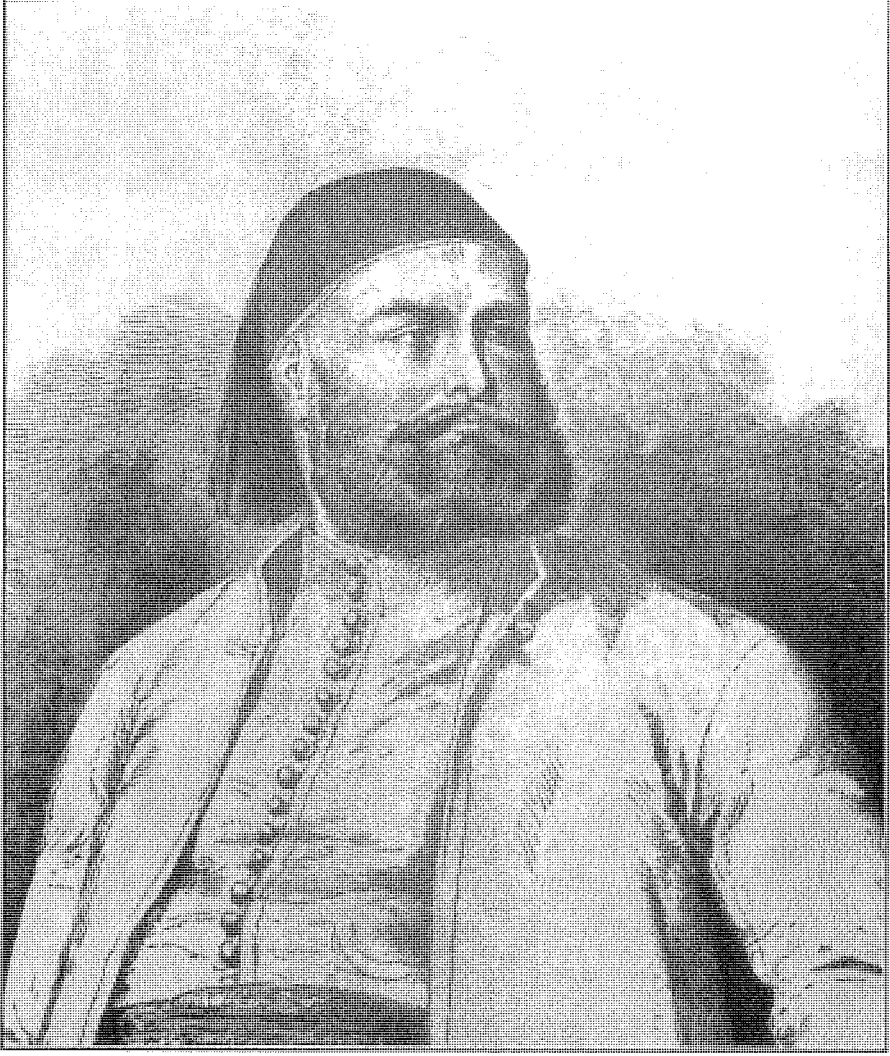
سعيد باشا أفتحه ديليسيس بحضر قنائة السويس